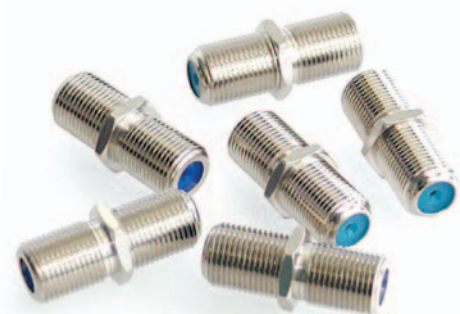
Adaptateurs F 81 HQ