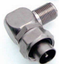
Adaptateurs coudé F / IEC